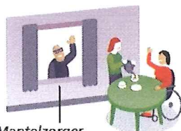
Mantelzorg kan er even uit