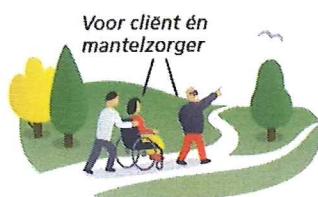
Voor cliënt én mantelzorg